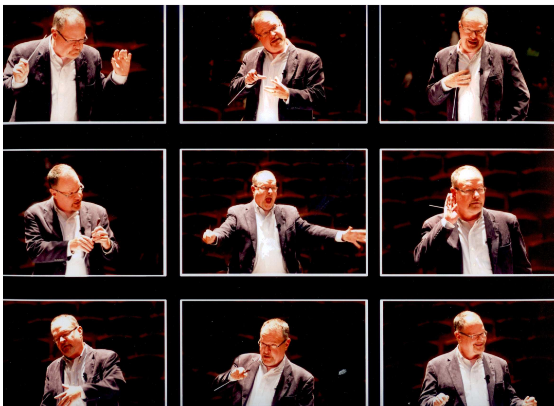
Immagini tratte dal "Melbourne Band Festival", Australia – Agosto 2010