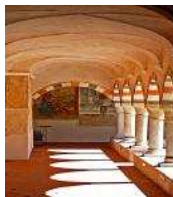
Auditorium S. Antonio di Morbegno (SO)

Qualora fosse necessario l'organizzazione sarà a disposizione per fornire indicazioni in merito alle possibilità di alloggio a Morbegno. Le spese di vitto ed alloggio sono interamente a carico dei partecipanti.